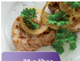
70 g lihaa

Runsasproteiiniset Nutridrinkit sisältävät proteiinia (18 g) eli yhtä paljon kuin seuraavat ruoka-annokset 4 :