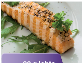
82 g lohta